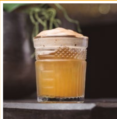
FARABBUD VILA NOVA 37.

VODKA, LIMÃO, GINGER E GRENADINE ARTESANAL