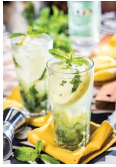
MOJITO DO SHEIK 36.

WHISKY, ARAK, HORTELÃ, FRUTAS CÍTRICAS (MARACUJÁ, LIMÃO, LARANJA) E XAROPE DE MEL.