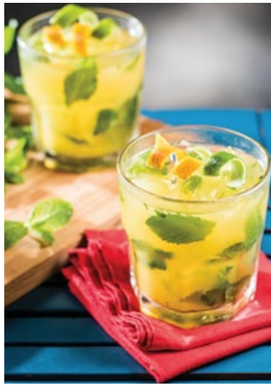
ARAK JULEP 33.

WHISKY, ARAK, HORTELÃ, FRUTAS CÍTRICAS (MARACUJÁ, LIMÃO, LARANJA) E XAROPE DE MEL.