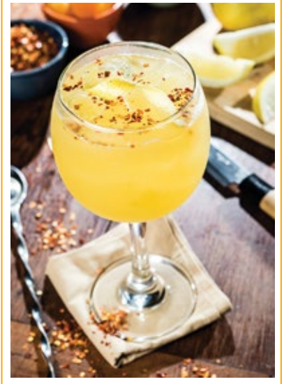
GIN SAJ 38.

RUM, HORTELÃ, UVAS, SUCO DE LIMÃO, ARAK, ÁGUA DE FLOR DE LARANJEIRA E ESPUMANTE.