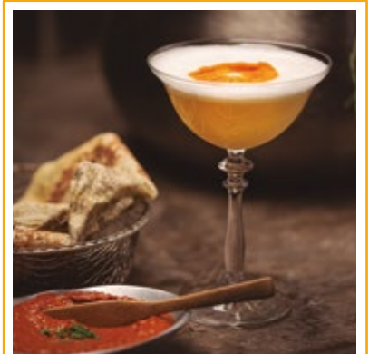
FARABBUD MOEMA 37.

GIN, ARAK, XAROPE DE CHAI, LIMÃO E ESPUMA DE TAMARINDO.